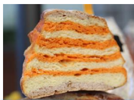
IL PANE DI SANT JORDI