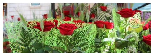
LE ROSE DI SANT JORDI